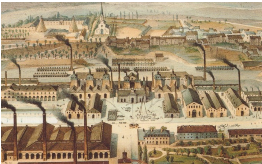
L'usine de Creusot peinte par Trémeaux en 1847.

D'après Bailleux de Marisy, Revue des deux mondes, 15 novembre 1872.