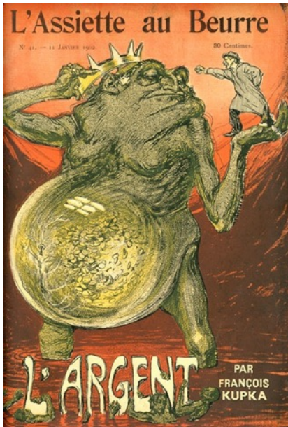
« L'argent », caricature de François Kupka parue en couverture de L'Assiette au Beurre, en janvier 1902.

Capitalisme : organisation de l'économie dans laquelle le capital des entreprises provient des banques, des industries et des actions vendues aux particuliers.