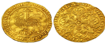
Mouton d'or de Jean II le Bon (1350-1364)

Louis IX a organisé la VIIe et la VIIIe croisade. Il meurt au cours de cette dernière devant Tunis. Sa vie a été racontée par Jean de Joinville.