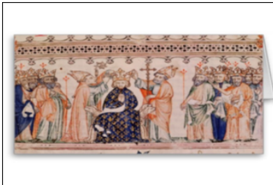
Sacre de Philippe III le Hardi