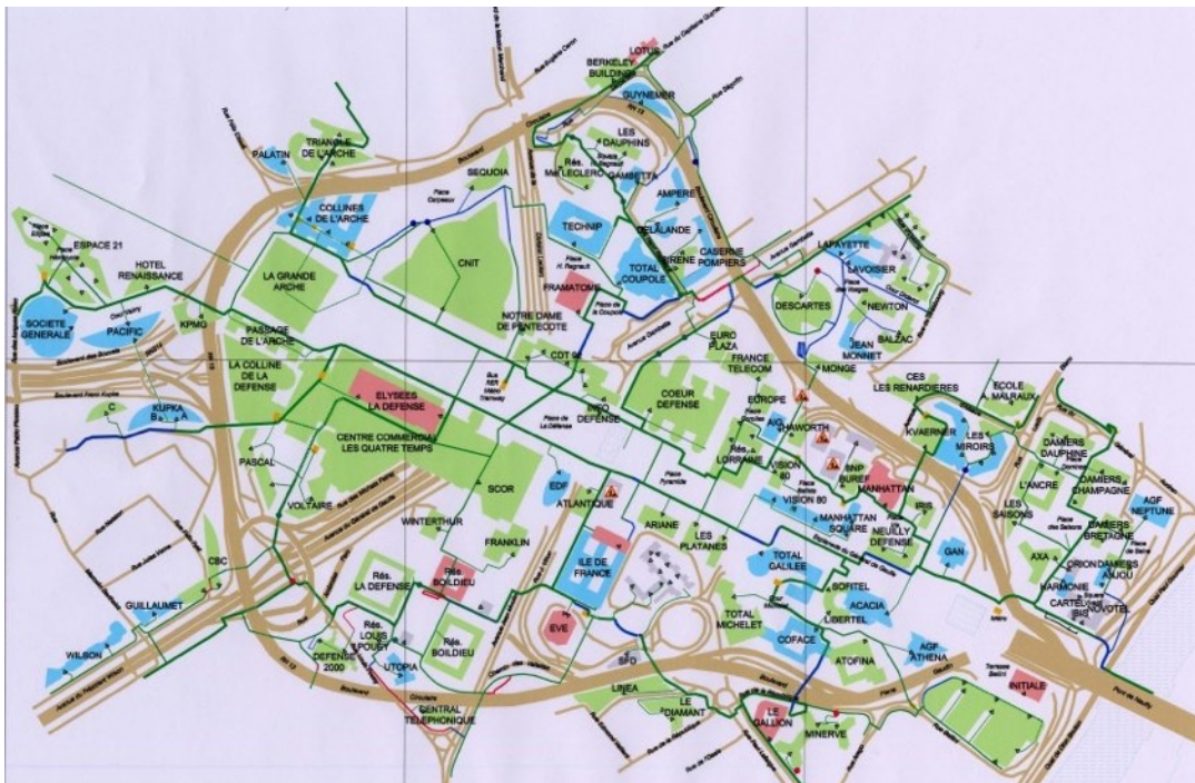
Plan du quartier de la Défense

En 1958, alors que le CNIT est achevé, l'Etat crée l'EPAD (Etablissement public d'aménagement de la Défense) pour y construire et animer un quartier d'affaires. Des tours sont construites pour accueillir les sièges sociaux d'entreprises. Malgré les crises qui touchent le quartier au milieu des années 70 puis pendant la décennie 90, il est aujourd'hui le premier quartier d'affaires d'Europe.