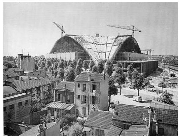
La Défense en 1956.

Tertiaire : secteur économique qui regroupe l'ensemble des activités de services (éducation, santé, commerce, transports).