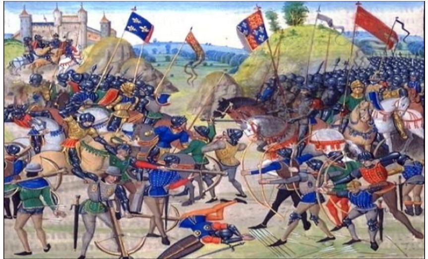
La bataille de Crécy en 1346, enluminure du XVe siècle.

Manufacture : atelier où l'on fabrique des objets en grande quantité et principalement à la main.