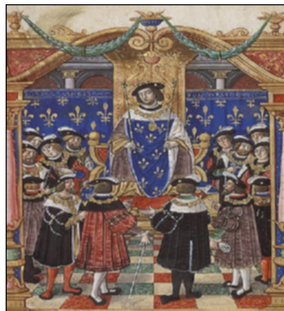
Louis dauphin, futur Louis XI.