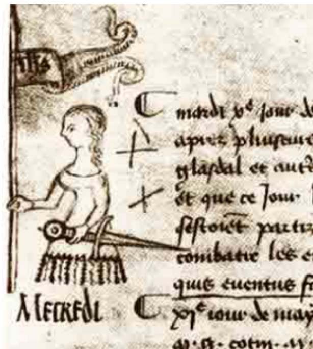
Portrait de Jeanne d'Arc