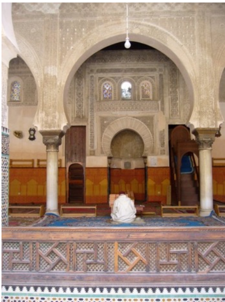
Le mirhab est une niche qui indique la direction de la Mecque vers laquelle prient les fidèles.