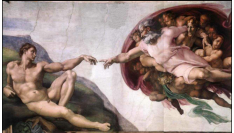
Le plafond de la chapelle Sixtine, au Vatican, peint par Michel Ange au début du XVIe siècle.