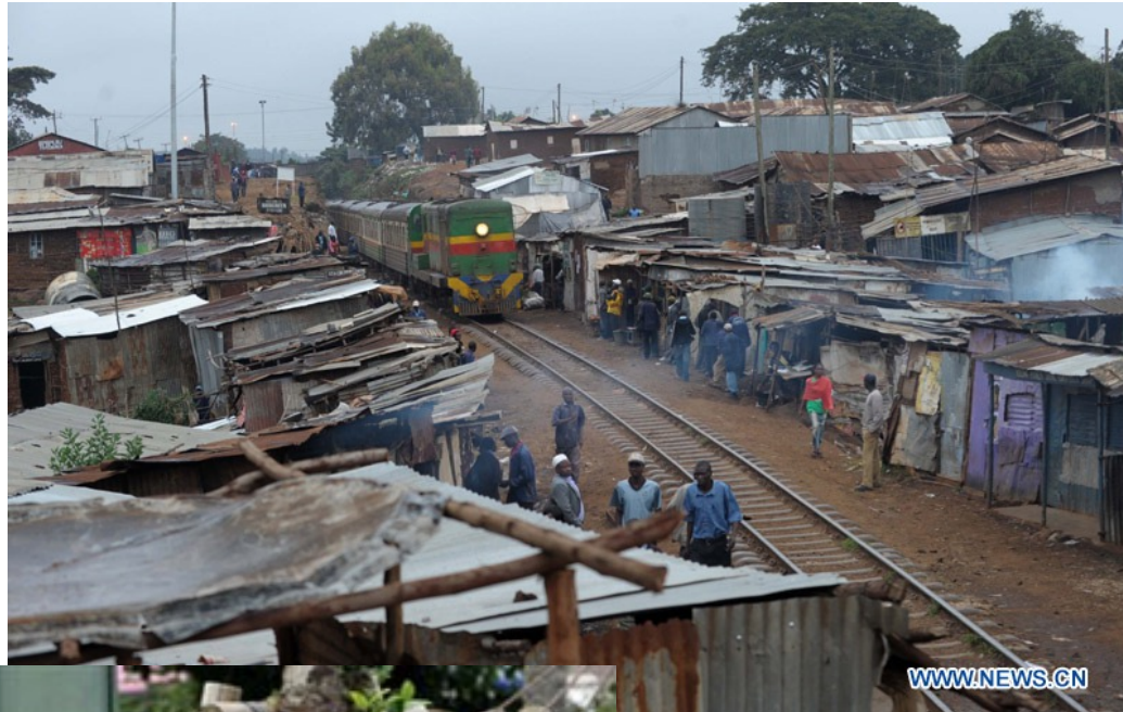
Le bidonville de Kibera, Kenya.