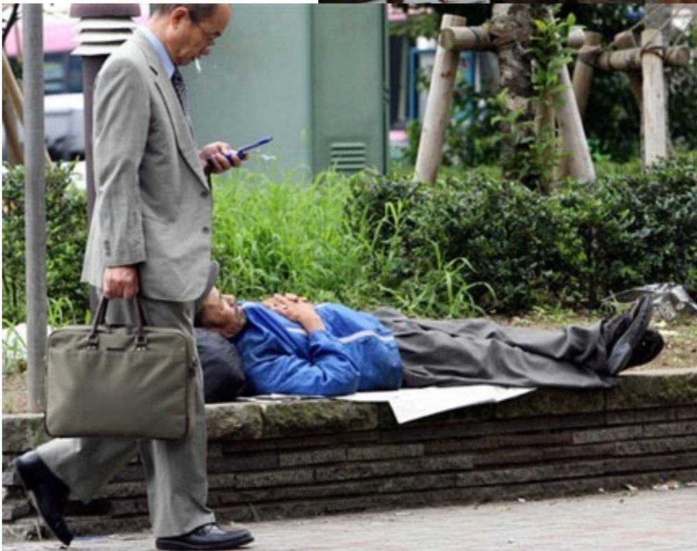
Sans domicile fixe (SDF) dans une rue de Tokyo (Japon). La ville compte entre 10000 et 14000 SDF.

Les inégalités de richesses existent entre le nord et le sud de la planète, mais aussi sur un même continent ou dans un même pays. Ainsi, en Chine, les différences sont importantes entre les villes, plutôt riches, et les campagnes, plus pauvres. De même, les littoraux industriels se développent, tandis que l'intérieur des terres, rural, est plus pauvres.