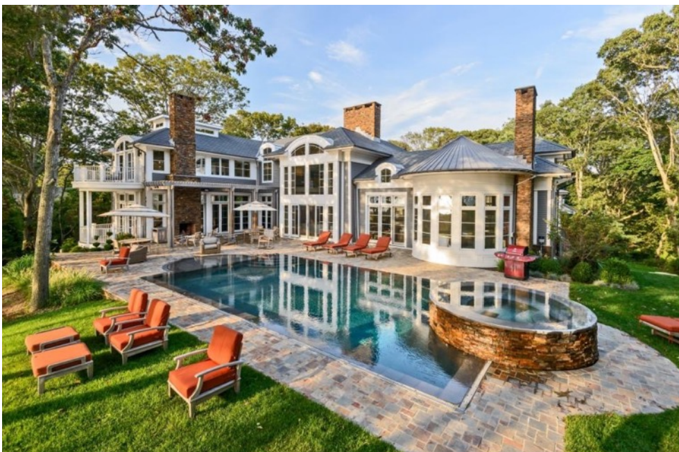
Maison dans les Hamptons (Etats-Unis).