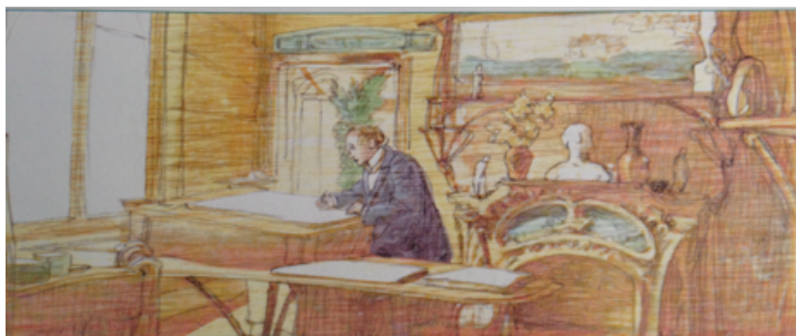
L'architecte établit un plan précis de sa nouvelle construction.