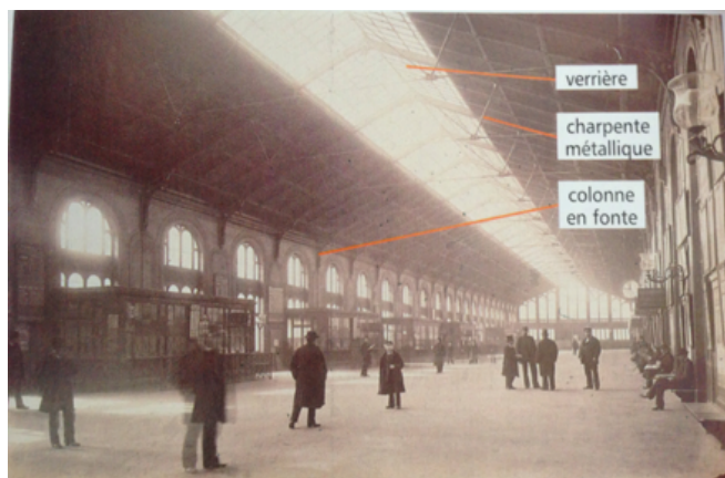
Grande salle des pas perdus de la banlieue, mars 1885 (Durandelle)

Alexandre Arnoux, Paris ma grand'ville, Flammarion.