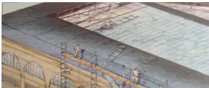
Les verrières sont installées.