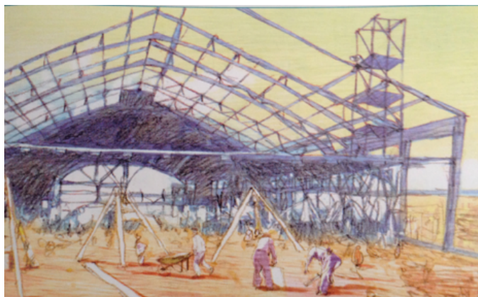
A la manière d'un Meccano géant, les barres de fer et les colonnes en fonte sont assemblées avec des rivets.