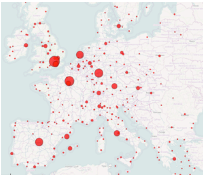
Le trafic des aéroports en Europe

Depuis les années 1990, les grandes compagnies aériennes comme Air France ont été concurrencées par de nouvelles compagnies qui offrent des tarifs très bas en proposant très peu de services. Elles ont connu un vif succès dans toute l'Europe et ont permis à de nouvelles personnes de prendre l'avion, car les billets sont moins chers. La clientèle est surtout touristique. Ces compagnies s'appellent des compagnies à bas coûts ou, en anglais, low cost.