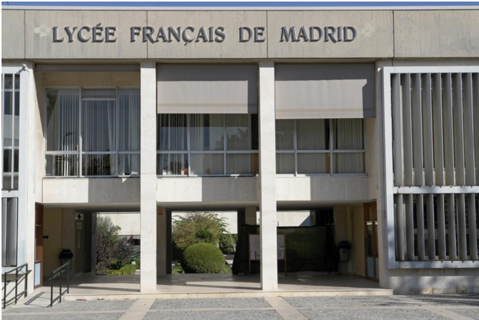
Entrée du Lycée français de Madrid.