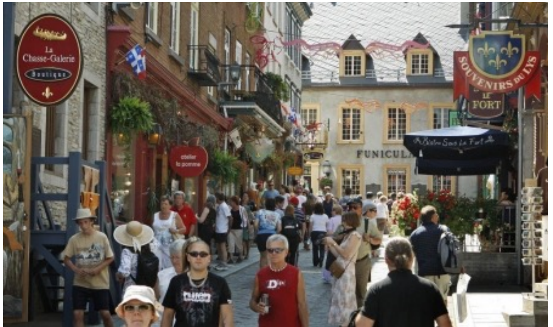
Une rue touristique de Québec, province de Québec (Canada).