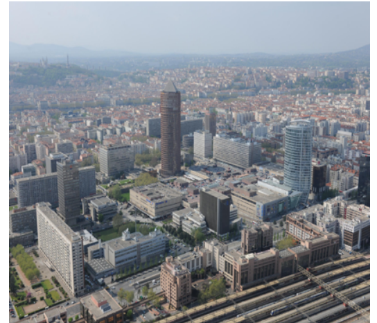
La Part-Dieu à Lyon dans le Rhône (Rhône-Alpes).

La construction du réseau à grande vitesse français a entraîné la création de gares nouvelles. Comme les autoroutes, les TGV, qui circulent à 300 km/h, ne passent pas dans le centre des villes, ils contournent les agglomérations. Des gares nouvelles TGV ont donc été construites sur les lignes à grande vitesse en périphérie des villes comme à Valence, à Avignon ou à Aix-en-Provence sur la LGV Méditerranée.