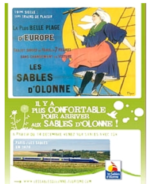
Affiche de la ville des Sables d'Olonne pour l'arrivée du TGV en 2008.