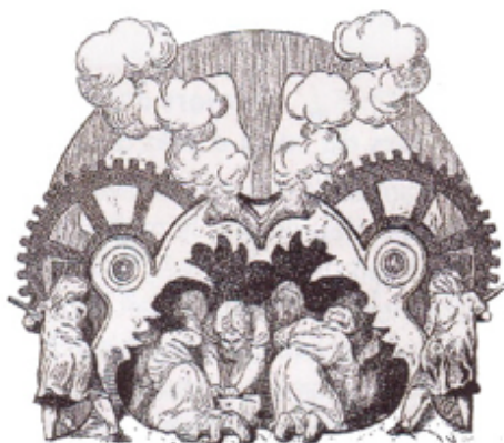
Gravure de Victor Hugo illustrant ce poème, 1880

Où vont tous les enfants dont pas un seul ne rit ? Ces doux êtres pensifs que la fièvre maigrit ? Ces filles de huit ans qu'on voit cheminer seules ? Ils s'en vont travailler quinze heures sous des meules ; Ils vont, de l'aube au soir, faire éternellement, Dans la même prison, le même mouvement. Accroupis sous les dents d'une machine sombre, Innocents dans un bagne, anges dans un enfer, Ils travaillent. Tout est d'airain, tout est de fer. Jamais on ne s'arrête et jamais on ne joue. Il fait à peine jour, ils sont déjà bien las..