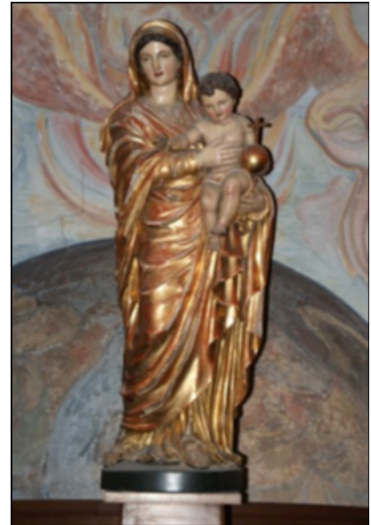
Statue représentant la Vierge et l'enfant

Moines au travail et en prière. Détail de la Thébaïde de Fra Angelico (1400-1455).