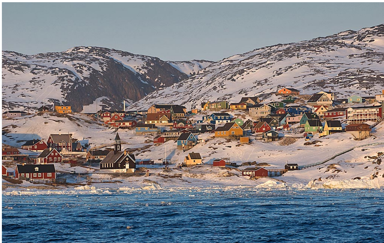
Ilulissat, à l'ouest du Groenland