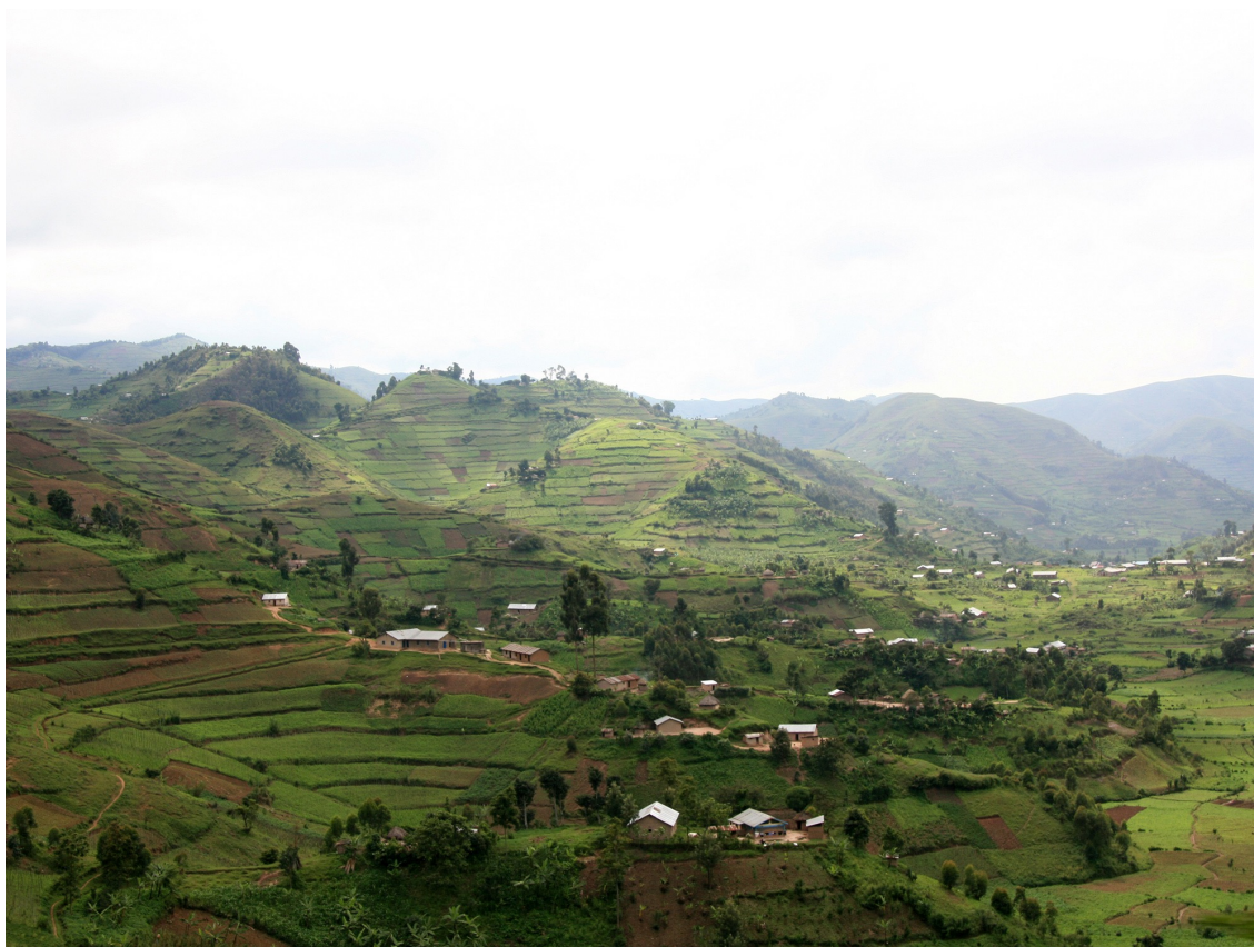
Collines et plateaux d'Ouganda