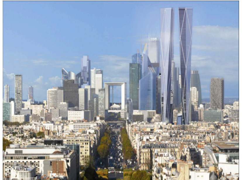
Le centre de Paris, vue sur le quartier de la Défense (Ile de France).

Le pouvoir des grandes villes françaises sur leur région.