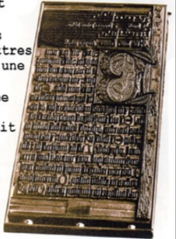
Planche en bois, XV e siècle.

La planche était ensuite encrée et pressée sur une feuille de papier dont la fabrication était connue depuis le XII e siècle en Europe.