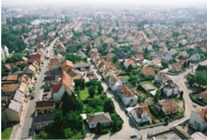
Commune périurbaine d'Eckbolsheim