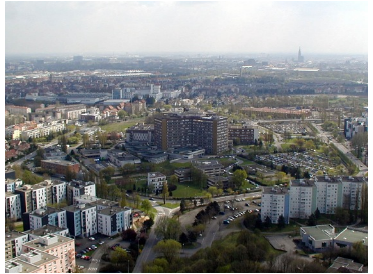
Quartier de Hautepierre, Strasbourg

Le développement urbain du XXe siècle a donné naissance aux banlieues, quartiers situés autour du centre et reliés à lui par un réseau de transports. Plus récemment, les villes ont débordé sur la campagne environnante, entraînant l'accroissement de la population des communes périurbaines. Cependant, du centre vers la périphérie, les densités de population diminuent.