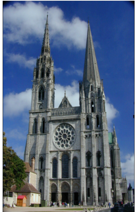
La cathédrale de Chartres.

Coupe d'une église gothique. Les croisées d'ogives, les gros piliers et les arcs-boutants permettent de supporter des murs et une toiture plus lourds.