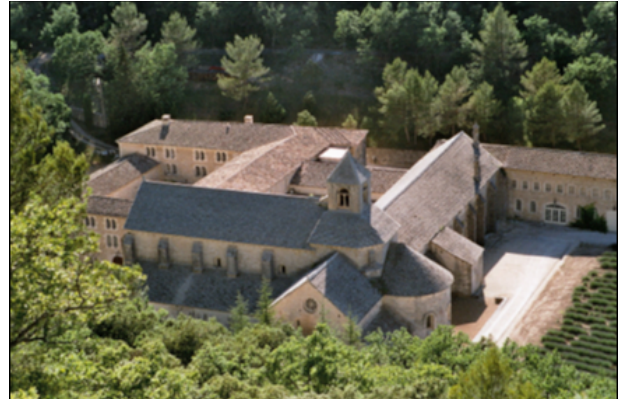
L'abbaye de Sénanque