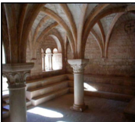
La salle capitulaire.

Art roman : art répandu en Europe occidentale de la fin de l'époque carolingienne jusqu'à la diffusion de l'art gothique.