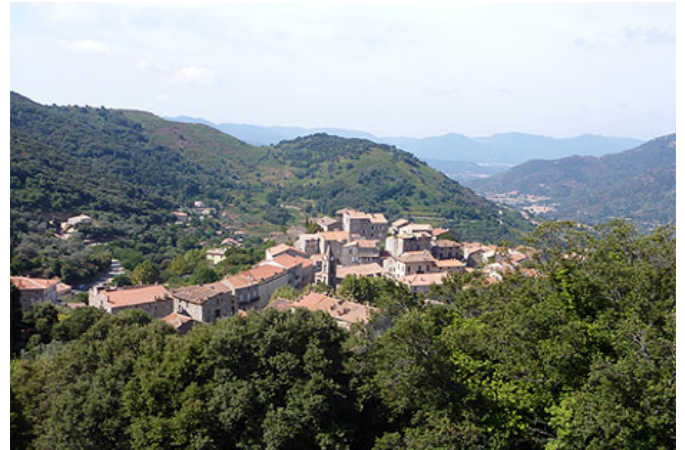
Village de Sainte-Lucie-de-Tallano, en Corse du Sud (Corse).