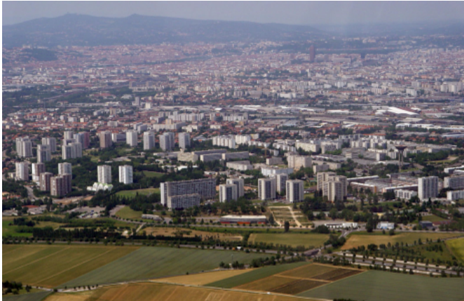
Vénissieux, au sud de Lyon, dans le Rhône (Rhône-Alpes).