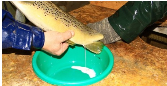
Elevage de truites