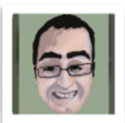
Nicolas Olivier @nicoguitare nicolasolivier.ovh