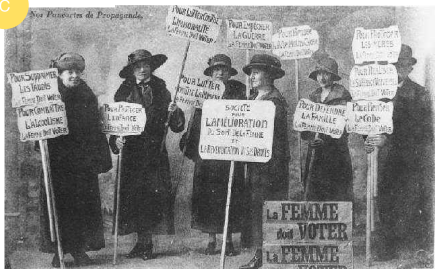
C : Manifestation de femmes en 1910.