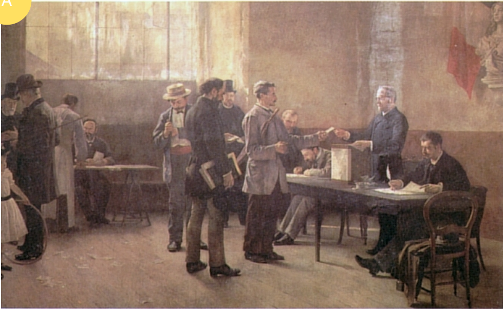
A : Bureau de vote, tableau d'Alfred Bramtot, 1891