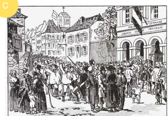
FIG. 237. — LE VOTE À LA CAMPAGNE EN 1848.