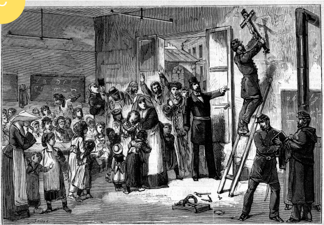
L'ENLÈVEMENT DES CRUCIFIX, DANS LES ÉCOLES DE LA VILLE DE PARIS. — (Dessin de M. Genaux.)